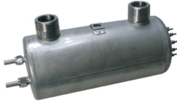
Vertical (C, D)